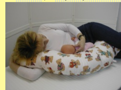
9. Poloha kojení v leže