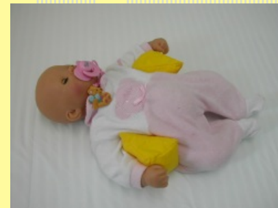
6. Klín do pažní jamky novoroz.