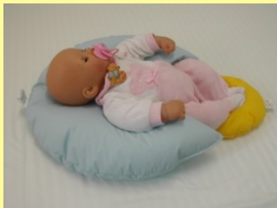
5. Poloha se stimulací dol. končetin