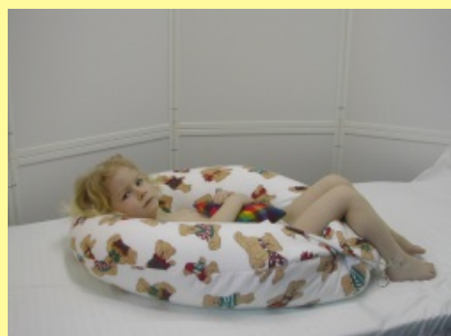
10. Poloha na zádech - hnízdečko