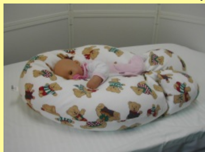
7. Poloha na boku