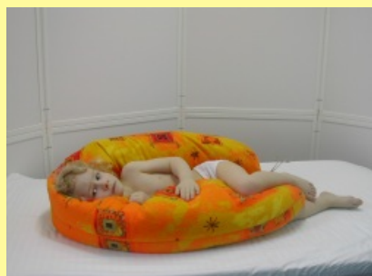
13. Poloha na boku se stabilizací hlavičky