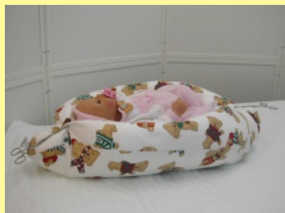
1. Pelíšek pro novorozence od 700g