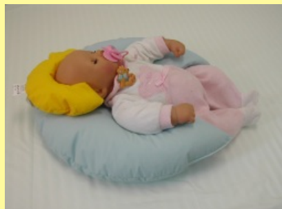
4. Poloha na zádech s fix. hlavičky