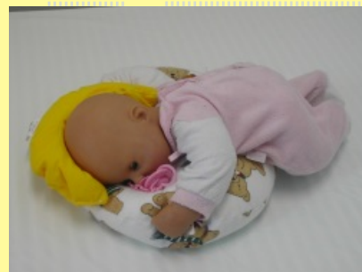
3. Poloha novorozence na bříšku