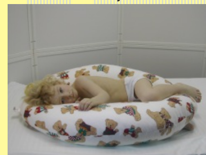
12. Poloha na boku