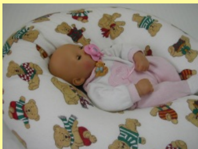
8. Poloha na zádech