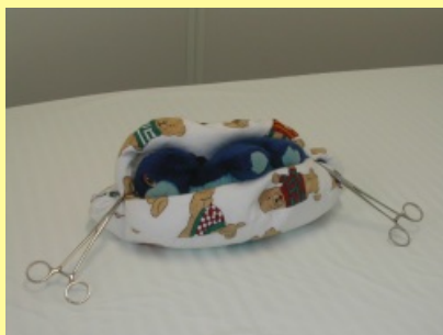
2. Pelíšek do inkubátoru do 700g