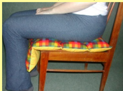
10.1.21.2 Opěrka s žebry IV.