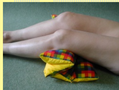
10.1.21.2 Opěrka s žebry III.