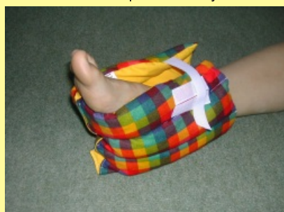
10.1.30.2 Chránič kotníku a paty I.