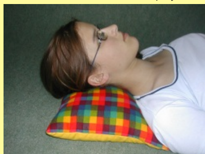
10.1.14.2 Polštář II.