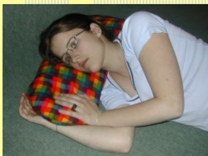
10.1.62.1 Polštář Napoleon