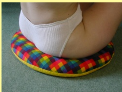
10.1.3.2 Sedací kruh