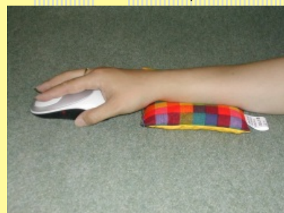
10.1.63.2 Podložka pod počítačovou myš

Zdravotnická technika pro nemocnice, domovy důchodců, ústavy sociální péče, agentury domácí péče, penziony a ostatní klienty.