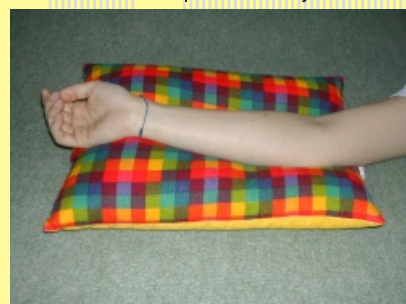
10.1.14.2 Polštář I.