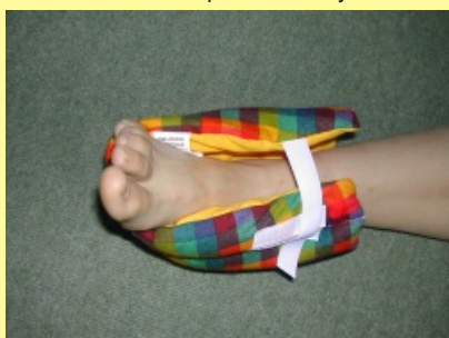
10.1.30.2 Chránič kotníku a paty II.