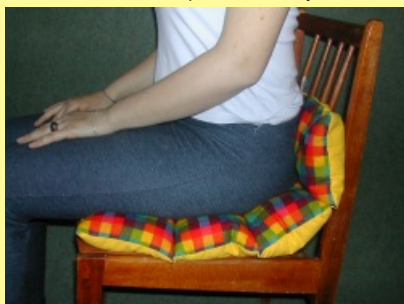
10.1.21.2 Opěrka s žebry V.