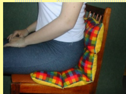
10.1.21.2 Opěrka s žebry VI.