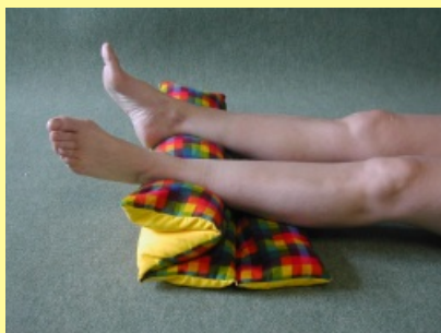
10.1.21.2 Opěrka s žebry II.