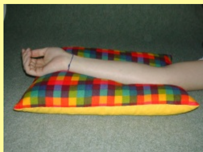
10.1.14.2 Polštář IV.