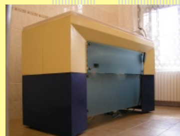
Horní poloha vany