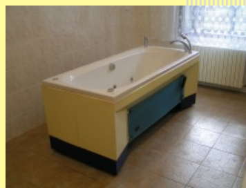
Dolní poloha vany