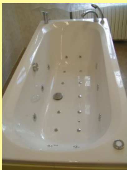
Ovládání vodní rehabilitace a perličky