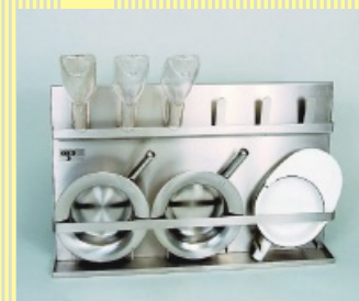
Držák mís a bažantů

Zdravotnická technika pro nemocnice, domovy důchodců, ústavy sociální péče, agentury domácí péče, penziony.