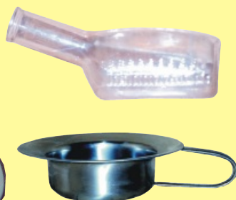
Bažant a nerezová podložní mísa