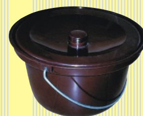
Plastová nádoba WC