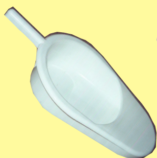
Plastová podložní mísa