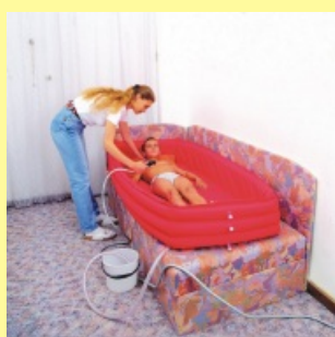
Tříkomorová domácí vana