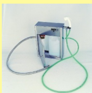
Desinfekční přístroj DV