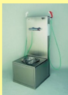
Sprchovací panel s výlevkou