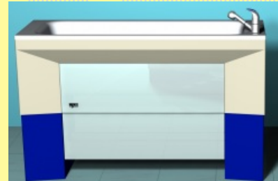
Zvedací vana CSO typ Jakub