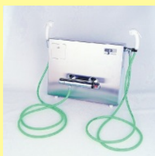
Sprchovací panel CSO