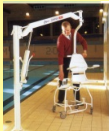
Bazénový zvedák DIPPER s příslušenstvím