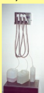
Desinfekční přístroj K3