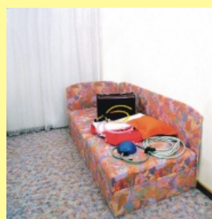
Sprchovací set pro HOMECARE