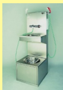
Sprchovací panel s výlevkou a umývadlem