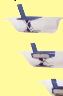
Elektrický zvedák do vany AQUATEC