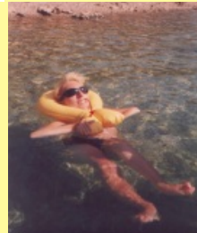
Plovací vesta pro invalidy